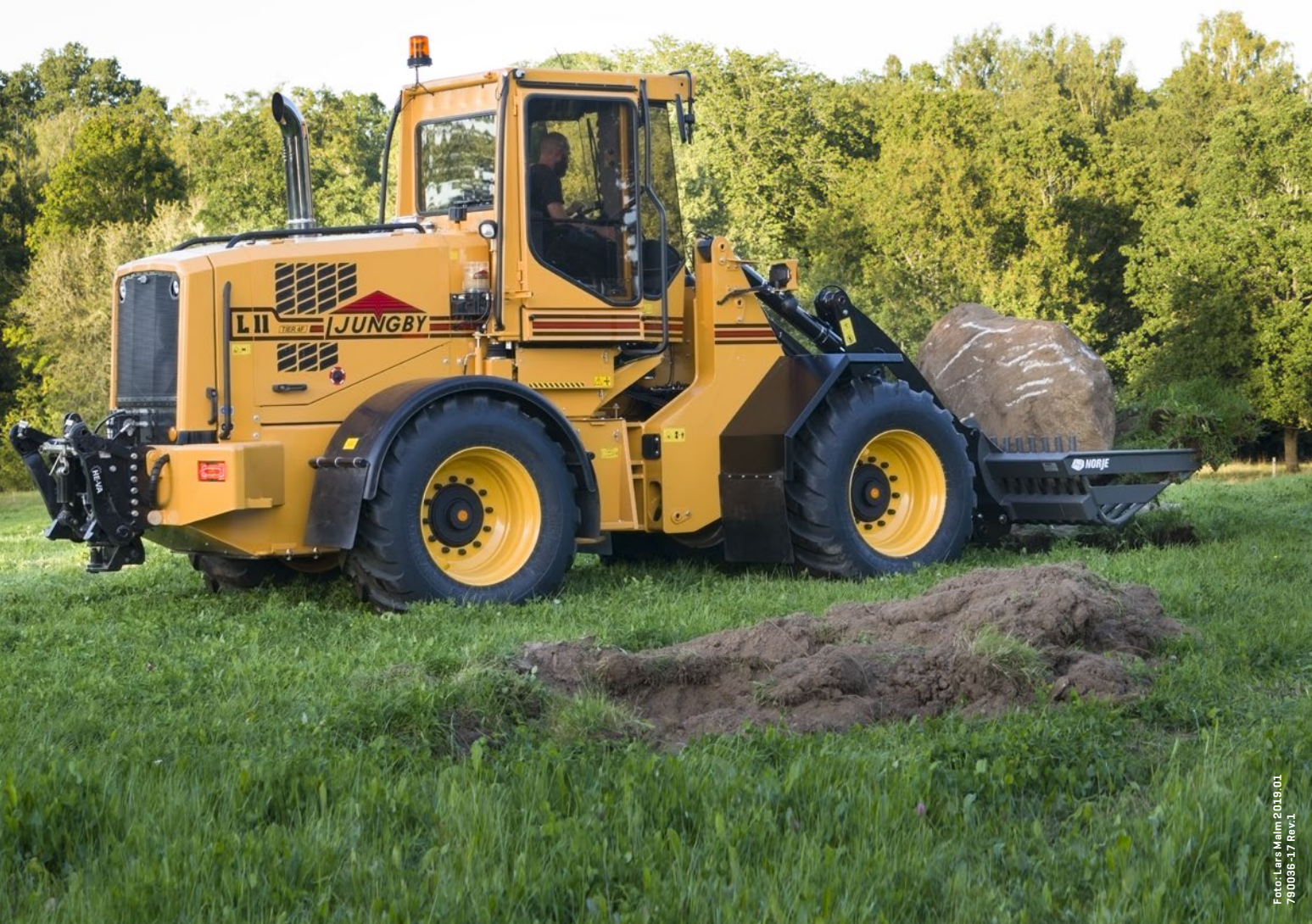
2019_01 790036-17 Rev.1